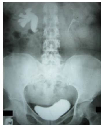
شکل ۱. تصویر IVU قبل از عمل در بیمار با RCU که نشان‌دهنده

در فاصله سال‌های ۱۳۹۱ تا ۱۳۹۳، چهار بیمار مبتلا به RCU شامل یک زن و سه مرد با سنین ۱۶، ۳۸، ۴۴ و ۴۸ سال (میانگین سنی ۳۶/۵ سال)، برای درمان به بخش ارولوژی بیمارستان شهید بهشتی همدان ارجاع داده شدند. سه بیمار از درد فلانک راست و یک بیمار از عفونت‌های مکرر سیستم ادراری (UTI) شکایت داشتند. اولتراسونوگرافی و اورگرافی داخل وریدی (IVU)، هیدرونفروز کلیه راست به میزان متوسط در سه بیمار و شدید در یک بیمار را نشان می‌داد. در تمام موارد، تغییر شکل S مانند که وجه مشخصه برای RCU است، قابل مشاهده بود (شکل ۱).