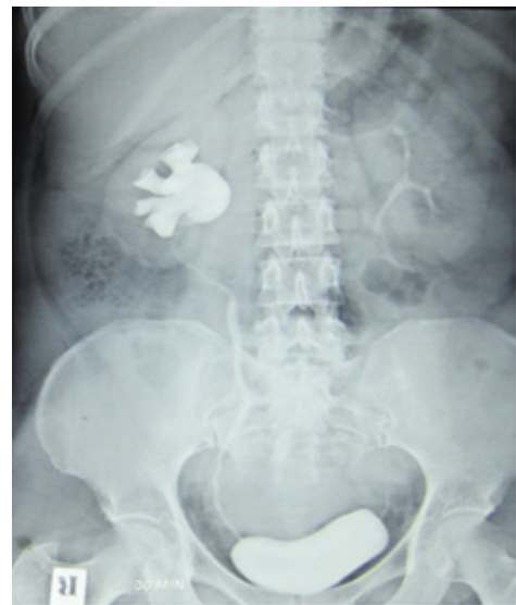
شکل ۵. تصویر IVP بیمار ۳ ماه بعد از جراحی پیلوپیلوستومی

تکنیک ما برای قرار دادن راحت‌تر استنت، استفاده از آنتن هدایت مرکزی در ست دیلاتورهای فلزی تلسکوپیک آلکین (کارل Storz، GmbH، Tuttlingen، آلمان) بود. بدین ترتیب که آنتن مذکور از طریق تروکار ۵ میلی‌متر به داخل حالب هدایت شد و به مستقیم شدن مسیر حالب کمک کرد و در نتیجه گاید وایر به راحتی و با حداقل تروما در حالب عبور داده شد و به دنبال خروج آنتن، دبل جی روی گاید وایر تعبیه شد. در انتها با کم کردن فشار پنموپریتونئال، اطمینان از هموستاز کافی حاصل شد و در نهایت گاز CO 2 خارج و یک درن در مسیر یکی از پورت‌های ۵ میلی‌متری تعبیه و محل سایر پورت‌ها سوچور شد. کاتتر فولی روز اول یا دوم پس از جراحی و درن بیمار ۲۴ ساعت پس از برداشتن کاتتر فولی، در صورت افزایش نیافتن درناژ، خارج شدند. استنت دبل جی بعد از ۴ هفته خارج شد. در پیگیری بیماران، اولتراسونوگرافی و IVU، به ترتیب یک و سه ماه پس از خروج دبل جی درخواست شدند (شکل ۵). بیماران تا ۱۲ ماه بعد از جراحی، تحت نظر بودند.