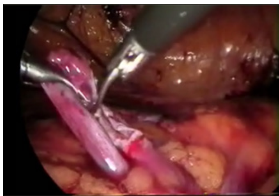
شکل ۳. نمای لاپاروسکوپیک برش دیستال لگنچه

قسمت دیستال لگنچه دیلاته برش داده و جدا شد (شکل ۳). حالب راست به قدام IVC جابه‌جا شد. سلامت و یکپارچگی سگمان رتروکاوآل حالب با عبور کاتترنلاتون 10Fr یا عبور گرسپ لاپاروسکوپیک از درون سگمان مذکور تأیید شد، سپس پیلوپیلوستومی با سوچوره‌های پیوسته پلی‌گلاکتین ۴-۰ روی کاتتر دبل جی که آنته‌گرید تعبیه شده بود، انجام شد (شکل ۴).