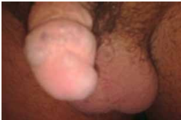
شکل ۱: همانژیوم گلنس پنیس

همانژیوم یک ضایعه عروقی خوش خیم است که از عروق مویرگی نابالغ تشکیل شده است. همانژیوم در ارگانهای مختلف گزارش شده اما در ژنیتالیا نادر است. فقط چند مورد از همانژیوم های گلنس پنیس تاکنون گزارش شده است. همانژیوم های گلنس پنیس معمولاً کوچک و بدون علامت هستند. احتمال خونریزی حین مقاربت گزارش شده است [۱]. در اغلب گزارشات، برداشت ضایعه با جراحی یا کرایوتراپی و یا لیزرتراپی توسط لیزر Nd:YAG برای درمان این ضایعات مطرح شده است. در این مطالعه یک مورد همانژیوم گلنس پنیس را معرفی می کنیم که تحت اسکروتراپی با کمک سدیم تترادسیل سولفات ۳٪ (TROMBOVAR) قرار می گیرد.