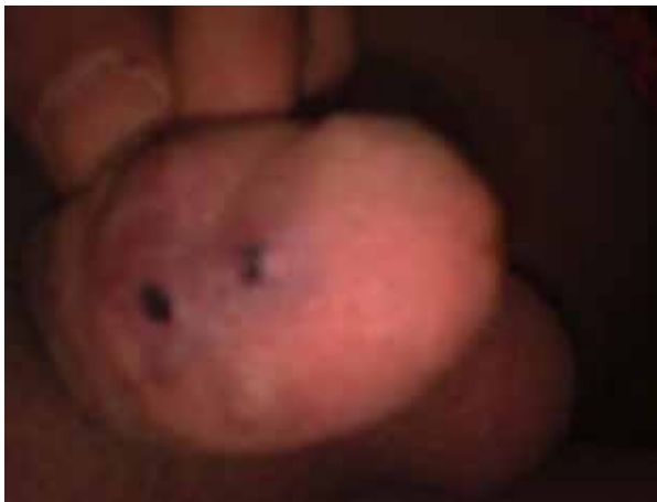
شکل ۳: یک هفته بعد از اسکروتراپی

اسکروتراپی توسط سدیم تترادسیل سولفات ۳% (TROMBOVAR) انجام شد (شکل ۳). سونوگرافی کالرداپلر یک هفته بعد از تزریق ماده اسکروزان هیچگونه جریان عروقی را نشان نداد (شکل ۴).