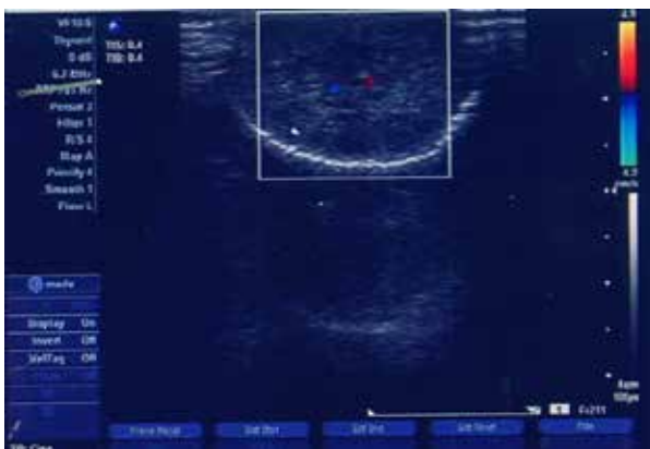
شکل ۴: سونوگرافی کالرداپلر همانژیوم گلنس پنیس بعد از اسکروتراپی